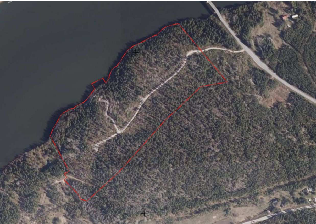
Flygbild över områdena